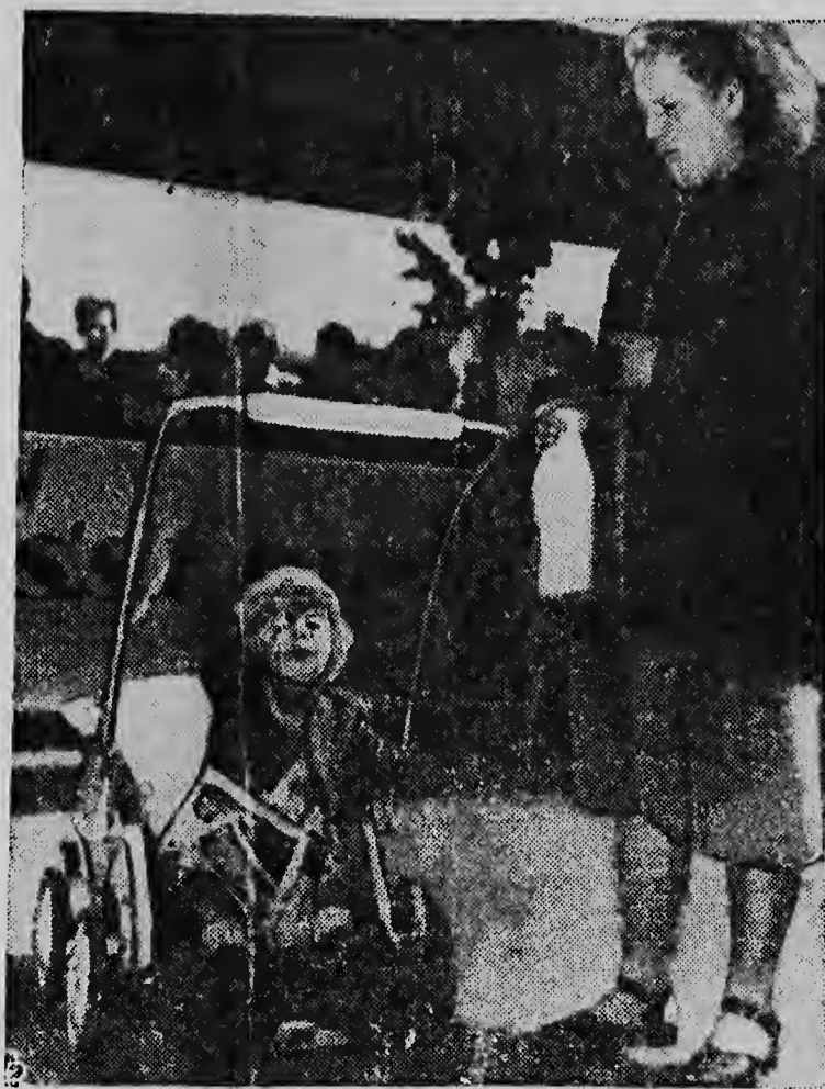
ONDANKS de verbitterde protesten van de Oostduitse regering tegen het Amerikaanse aanbod om voedsel te sturen voor hongerend Oost Duitsland, blijven hongerigen uit het Oosten naar de in het Westen ingerichte hulpmarkten stromen. Het Amerikaanse voedsel wordt verkocht tegen een prijs, welke slechts 20 procent bedraagt van de in Oost Duitsland geldende prijzen. Hier krijgt een Oostduits baby-tje een fles melk, hetgeen in het Oosten een ware luxe is.